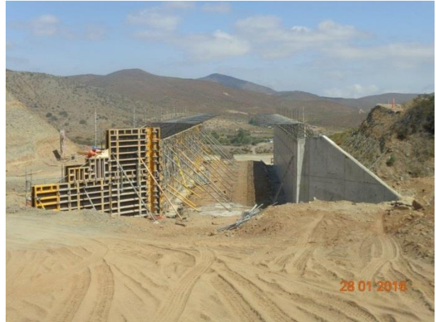
Enfierraduras, Moldaje y Hormigon - Atravesio EL Totoral Tramo 1