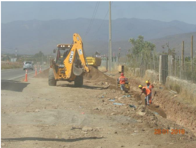
Trabajos de Modificación de servicios – APR Las Barrancas Tramo 1