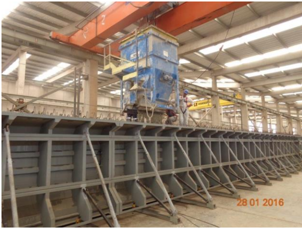
Hormigonado Viga de Prueba – MASPIR