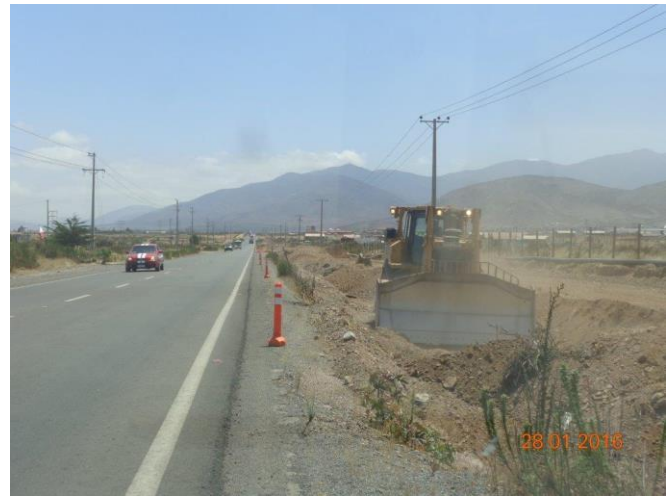
Trabajos de escarpe - Calzada derecha Tramo 1